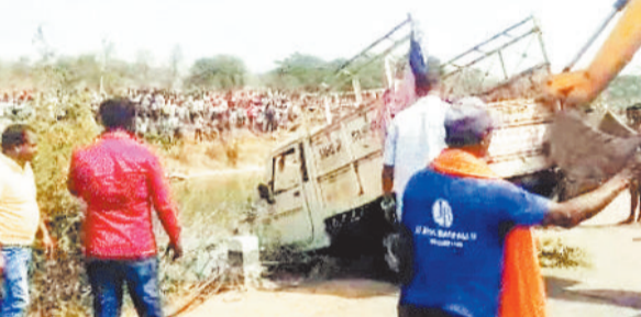
नहर से पिकअप वाहन को बाहर निकालते हुए।

पड़ोसी जिले के सक्ती रेड़ा से लगभग 2 दर्जन लोग छठी कार्यक्रम में शामिल होने के लिए उरगा खरहरी आ रहे थे कि तेज रफतार