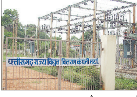
छत्तीसगढ़ राज्य विद्युत वितरण कंपनी लि.

गर्मी के दस्तक देते ही वनांचल क्षेत्र के लगभग एक दर्जन गांवों में पावरकट, लो वोल्टेज की समस्या फिर से शुरू हो गई है। इस क्षेत्र के ग्रामीण लगातार अधिकारियों से लो वोल्टेज की समस्या से निजात दिलाने गुहार लगा रहे हैं लेकिन उनकी समस्याओं का समाधान नहीं हो पा रहा है जिससे लगातार उनकी परेशानी बढ़ती ही जा रही है।