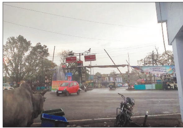
मौसम बदलते ही हल्की बारिश के साथ आसमान में छाए बादल।

मौसम में आये बदलाव से दिन ढलने के बाद लोगों को तेज हवा के साथ हल्की बारिश होने पर दिन के तेज तापमान से कुछ राहत मिल रही है। वहीं देर शाम तक बिजली गुल रहने से आम लोगों को परेशानी का सामना करना पड़ रहा है। दो दिन पूर्व तेज बारिश से कई स्थानों में पेड़ गिरने की घटनाएं हुई थीं और लोगों को गर्मी से राहत तो मिली थी। रविवार सुबह से ही हवाएं चल रही थीं किंतु दोपहर होते ही तेज धूप से बढ़े हुए तापमान ने लोगों को हलाकान कर दिया था। अचानक शाम 4 बजे के बाद आसमान में बादल छाने लगे और तेज हवाएं चलने से शहर के कई स्थानों में हल्की बारिश भी हुई। बारिश का यह दौर हालांकि ज्यादा