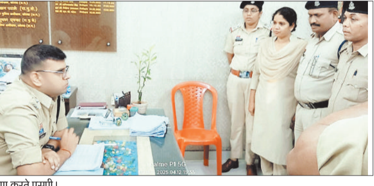
निरीक्षण करते एसपी।