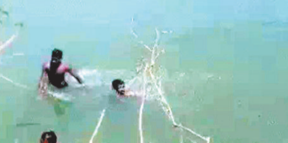
नहर में लापता लोगों को तलाश करती गोताखोरों की टीम।