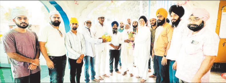
गुरुद्वारा पहुंचे मुस्लिम समाज के सदस्य।