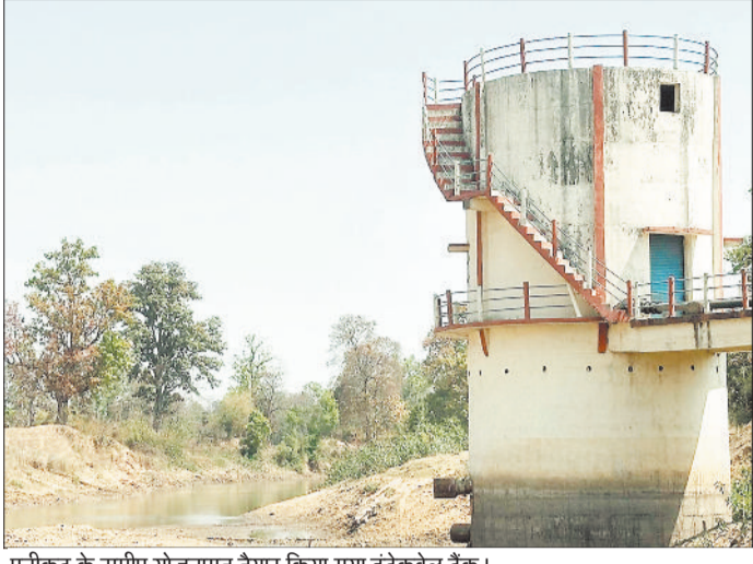
एनीकट के समीप योजनागत तैयार किया गया इंटेकवेल टैंक।

पाली नगर पंचायत गठन के बाद क्षेत्र की सबसे बड़ी पेयजल समस्या के निराकरण के लिए जलावर्धन योजना लोक स्वास्थ्य यांत्रिकी विभाग के द्वारा वर्ष 2019 में तैयार की थी। इस योजना के अंतर्गत मुनगाडीह एनीकट से पानी लाकर नगर पंचायत के वाडों में और नगर पंचायत की सीमा से लगे ग्रामों के कुछ मोहल्लों में पानी सप्लाई करना था। योजना की जब शुरुआत हुई तब लोगों को यह उम्मीद जगी कि जल्द ही नगर की पेयजल की समस्या का निराकरण हो जाएगा। मुनगाडीह में सिंचाई विभाग का पहले से ही एनीकट निर्माण था। बहरहासी नाले में सिंचाई विभाग ने