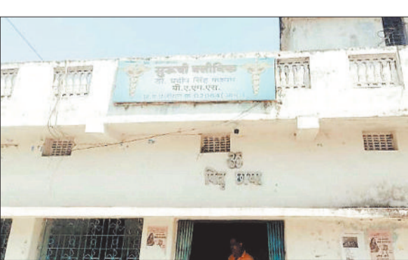
ग्राम इमलीभांठा में संचालित क्लीनिक।