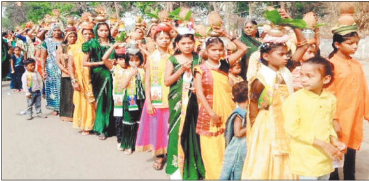
कलश यात्रा में शामिल महिलाएं एवं युवतियां।